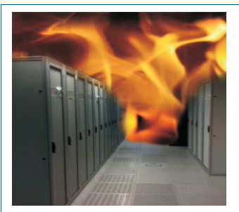
Abb.: Ein Brand in unternehmenswichtigen Räumen wie Serverraum oder Produktionsbereich kann für kleinere und mittlere Unternehmen katastrophale Folgen haben. Schützen Sie auch Ihre entfernten Niederlassungen mit den netzwerkgestützten Fernüberwachungslösungen von AKCP Inc.

Da der AKCP Rauchmeldesensor zusätzlich mit einem potentialfreien Kontakt ausgestattet ist, kann der Anschluss auch via potentialfreien Eingang an die sensorProbe8-X20 , sensorProbe8-X60 , securityProbe-X20 sowie securityProbe-X60 erfolgen. So können Sie eine Vielzahl von Rauchmeldern anschließen. Ideal für die Brandfrüherkennung / Branddetektion in großen Infrastrukturen.