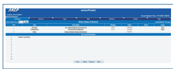
Abb.: Im intuitiv zu bedienenden Webinterface des sensorProbe2 Remote-Monitoringsystems kann der SNMP-fähige Rauchmelder bequem konfiguriert werden. Hier geben Sie auch die gewünschten Alarm- und Benachrichtigungsarten ein.

Abb.: Ein Brand in unternehmenswichtigen Räumen wie Serverraum oder Produktionsbereich kann für kleinere und mittlere Unternehmen katastrophale Folgen haben. Schützen Sie auch Ihre entfernten Niederlassungen mit den netzwerkgestützten Fernüberwachungslösungen von AKCP Inc.